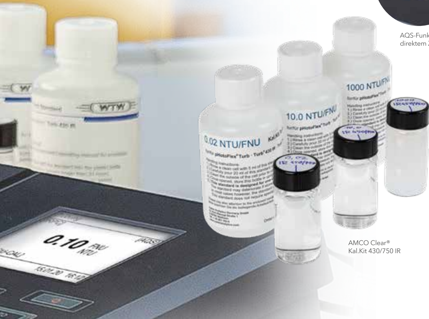
AMCO Clear® Kal.Kit 430/750 IR